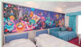
「ウィッシュ」スタンダードルーム(一例)

パークの夢や冒険をそのままに手軽なリゾートステイを楽しめるホテル。 新浦安エリアに位置し、シンプルなサービススタイルで手軽にリゾートステイをお楽しみいただけます。 冒険や発見がテーマの「東京ディズニーセレブレーションホテル:ディスカパー」と、 夢やファンタジーがテーマの「東京ディズニーセレブレーションホテル:ウィッシュ」の2棟からなります。