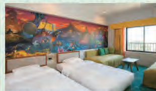
「ディスカパー」スタンダードルーム(一例)