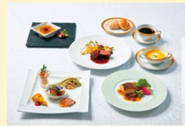
A.フレンチフルコース

オードブル盛り合わせ/御前崎産鮮魚の造り盛り合わせ/牛フィレのステーキ赤ワインソース お食事じゃこ御飯/香の物、椀物/シフォンケーキ季節のフルーツ添え/コーヒー