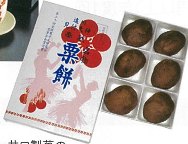
井口製菓の 「6個入りあわもち(栗餅)」