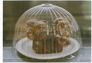
おうちでのご狩り!しいたけ栽培キット