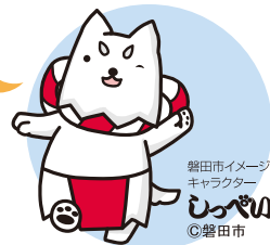
磐田市イメージ キャラクター いわた